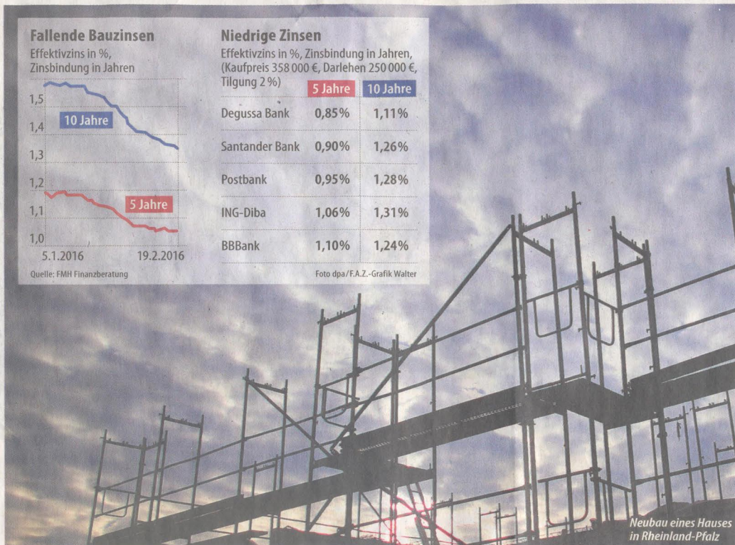
Neubau eines Hauses in Rheinland-Pfalz

In vielen Fällen scheinen die bundesweiten Direktbanken günstiger in der Baufinanzierung zu sein als die regionalen Institute. Allerdings gilt das offenbar auch nicht für alle Fälle. Beim Internetvergleichsportal Biallo beispielsweise liegt im Augenblick die Sparda-Bank Nürnberg bei der Baufinanzierung auf dem ersten Platz. Sie nennt dort einen effektiven Jahreszins von 0,96 Prozent für einen Kredit mit zehn Jahren Zinsbindung. Allerdings finanziert die Sparda-Bank nur Bauprojekte in ihrer Region, wie es auf Nachfrage hieß: im Gebiet rund um Nürnberg.